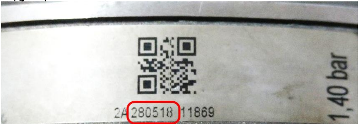
Дата производства указана после «2А»